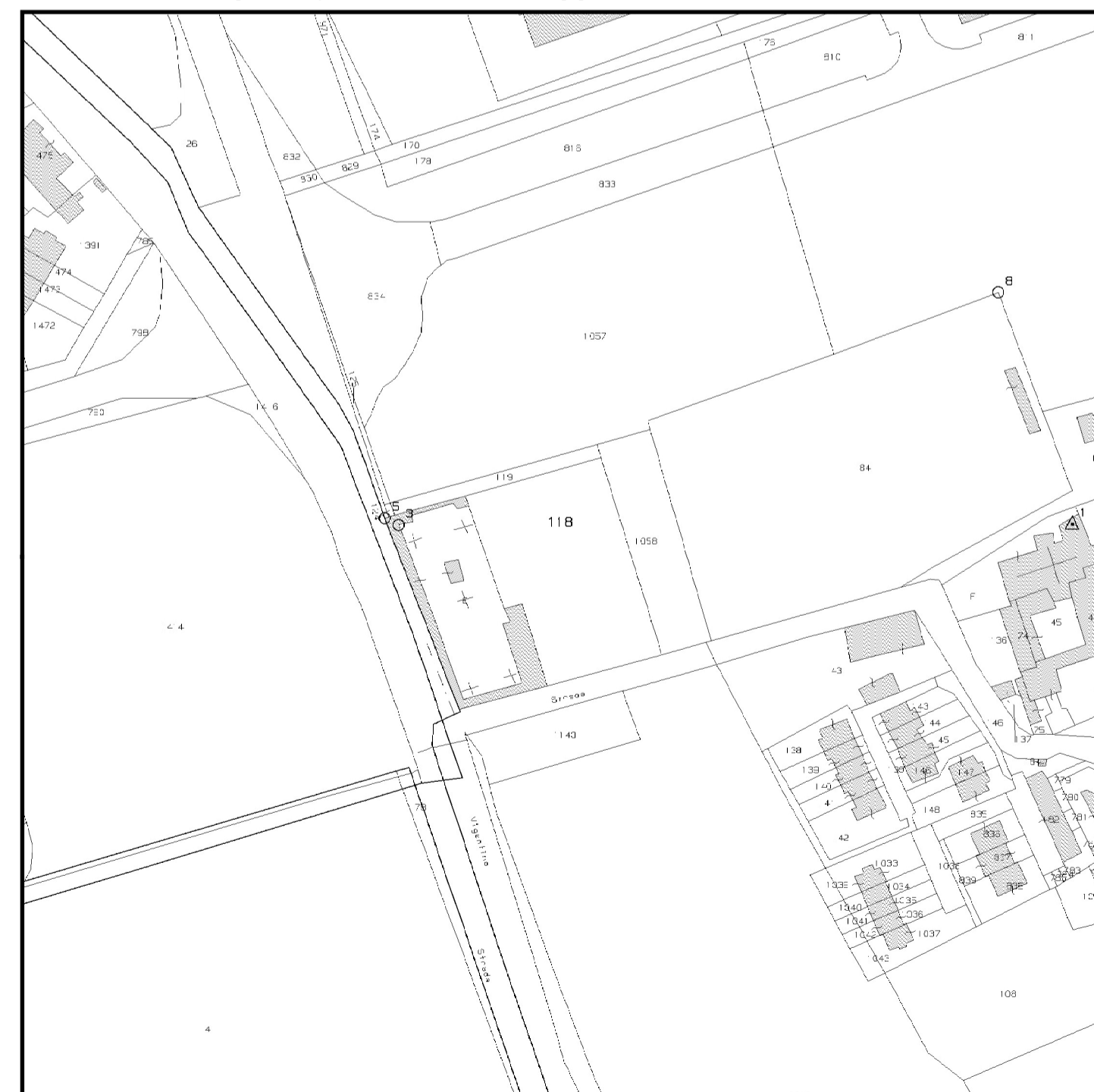
Cimitero di Campomorto - Estratto di mappa catastale scala 1:2.000