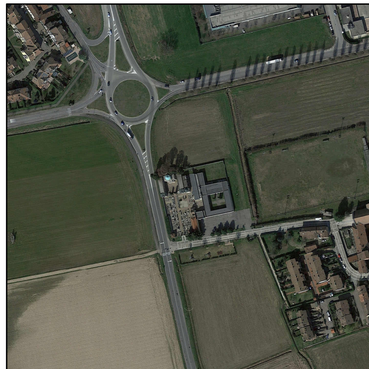
Cimitero di Campomorto - Aerofoto scala 1:2.000