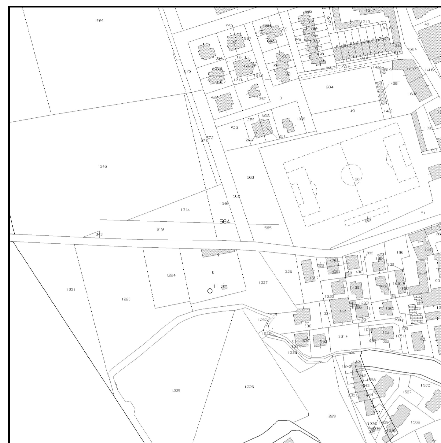
Cimitero del Capoluogo - Estratto di mappa catastale scala 1:2.000