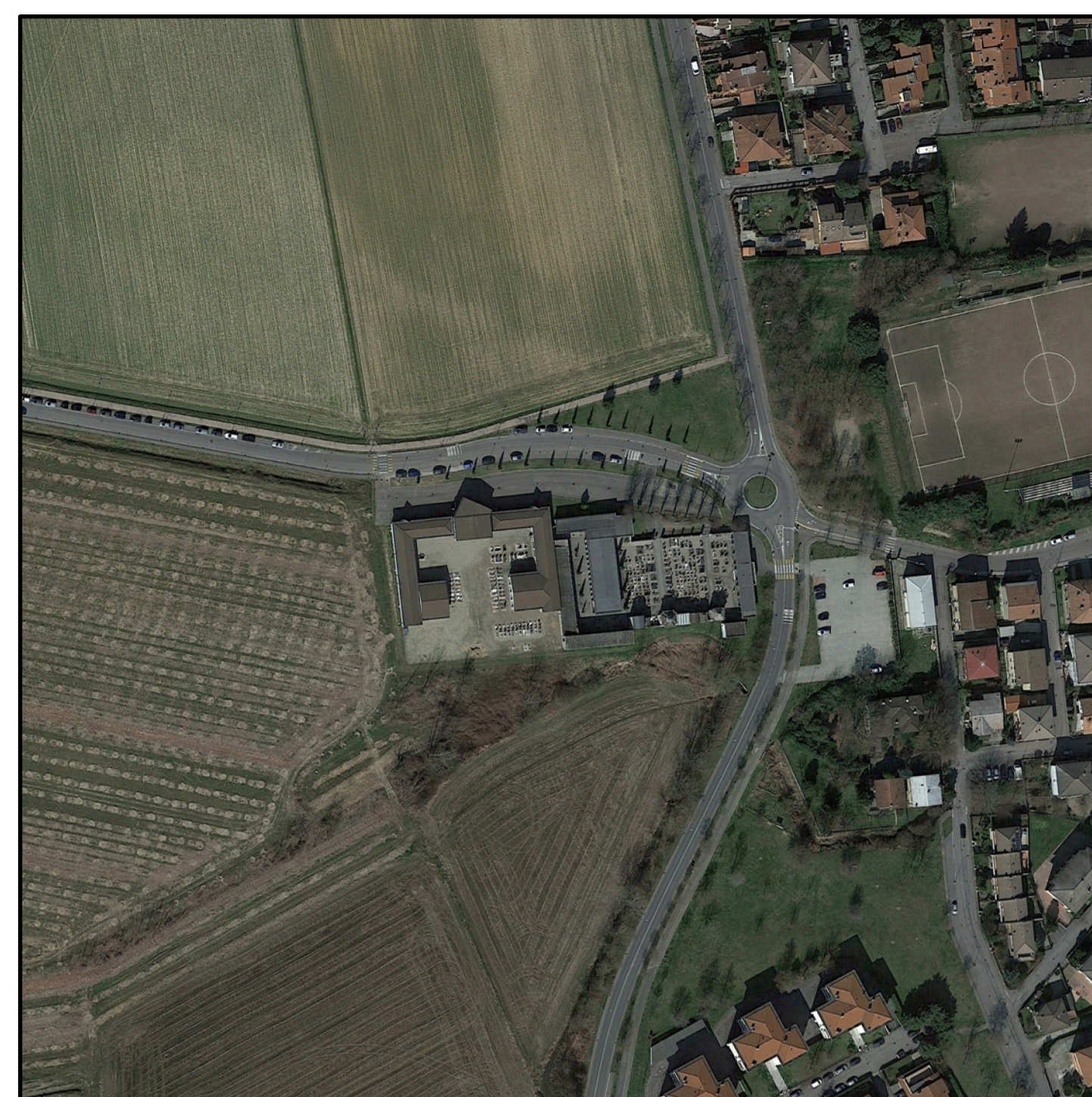
Cimitero del Capoluogo - Aerofoto scala 1:2.000